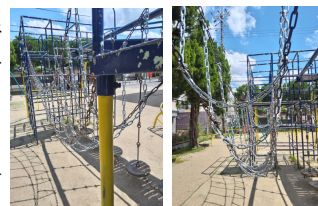
綺麗に蘇った遊具