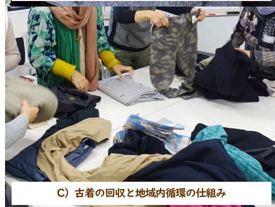
C) 古着の回収と地域内循環の仕組み