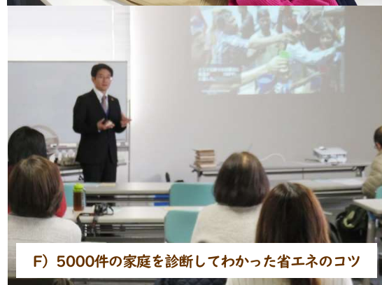
F) 5000件の家庭を診断してわかった省エネのコツ