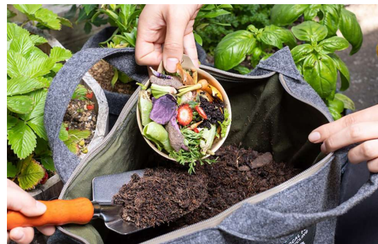
B) 生ごみから美味しい野菜をつくるコンポスト