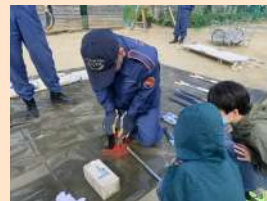
救出7つ道具を用いた倒壊家屋からの救出