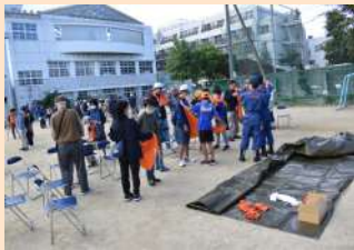
三角巾を使っての応急手当

訓練終了後には、上京消防団中立分団の放水訓練と上京中学校吹奏楽部の演奏をそれぞれ披露していただきました。ありがとうございました。