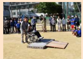
車椅子を使っての介護訓練