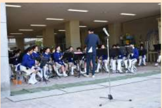
上京中学校吹奏楽部

今回の訓練には、新町小学校の子ども達もたくさん参加してくれました。熱心に取り組んでいる姿は、とても頼もしく感じました。