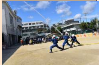
消防団による放水訓練